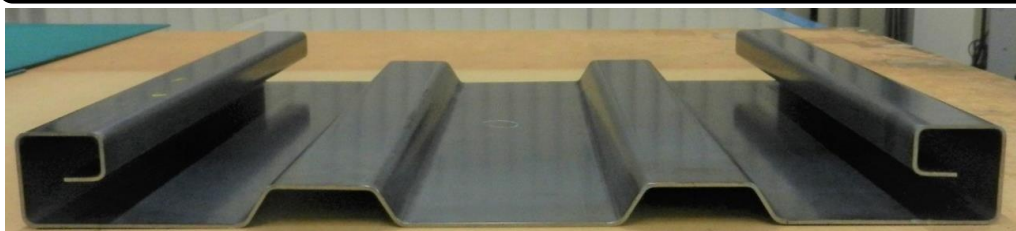
↑写真は試作のため短いですが、実際の製品は長さ2000ありました 450